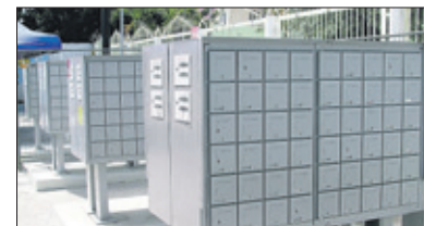
Het briefbussenproject in sommige wijken van Curaçao kwam zonder dat er wetgeving aan ten grondslag lag.

In deel 2: De invulling van democratie verschilt per samenleving