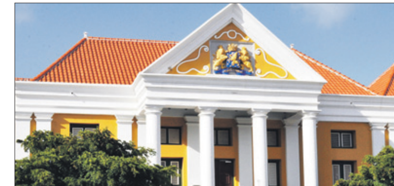
De manier waarop rechters tot hun beslissingen moeten komen is gedetailleerd vastgelegd in de verschillende wetboeken. Op de foto het gerechtshof van Curaçao.

Voor zover de rule of law procedures eist en een formele kwaliteitsstandaard hanteert waaraan het recht moet voldoen, is zij 'waardenvrij'. Formaliteiten en procedures alleen garanderen nog geen rechtvaardige samenleving, al dragen zij daar wel bij tot het creëren van voor spelbaarheid en zekerheid wel in belangrijke mate aan bij. Van belang is uiteindelijk echter niet zozeer het inhoudelijk-ethische aspect van het recht. In de kern kan dit inhoudelijk-ethische aspect worden omschreven als de ambitie om bij te dragen aan de verwezenlijking van liberie, egalité et fraternité, van vrijheid, gelijkheid en gemeenschap, die uitwerking heeft gekregen in tal van andere nationale en internationale documenten, waaronder de Universele Verklaring van de