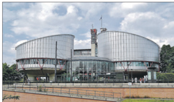
Het onderkomen van het Europees hof voor de Rechten van de mens in Straatsburg. Dit Europees hof is ook voor Curaçao de hoeder van de fundamentele rechten.